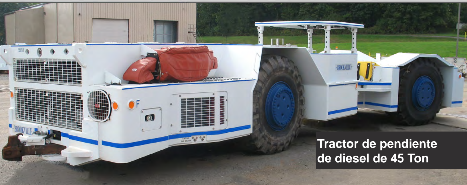
Tractor de pendiente de diesel de 45 Ton