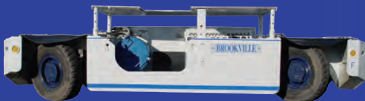
Vehículo de inspección de doble dirección para 2 personas – 9.1 Ton y 97 cms de altura