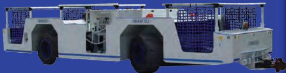
Vehículo de transporte de personal de dirección múltiple para 20 personas – 13.6 Ton y 145 cms de altura

Disponibles con dirección en las cuatro ruedas o con junta articulada, el equipamiento minero sobre ruedas Brookville está diseñado para ambientes con espacio limitado que impiden el tendido de vías. Con una línea que incluye vehículos para el transporte de personal, de inspección, tractores de remolque articulados y vehículos de mantenimiento muy personalizables, Brookville diseña equipamiento de primer nivel para cubrir todas sus necesidades operativas y de mantenimiento.